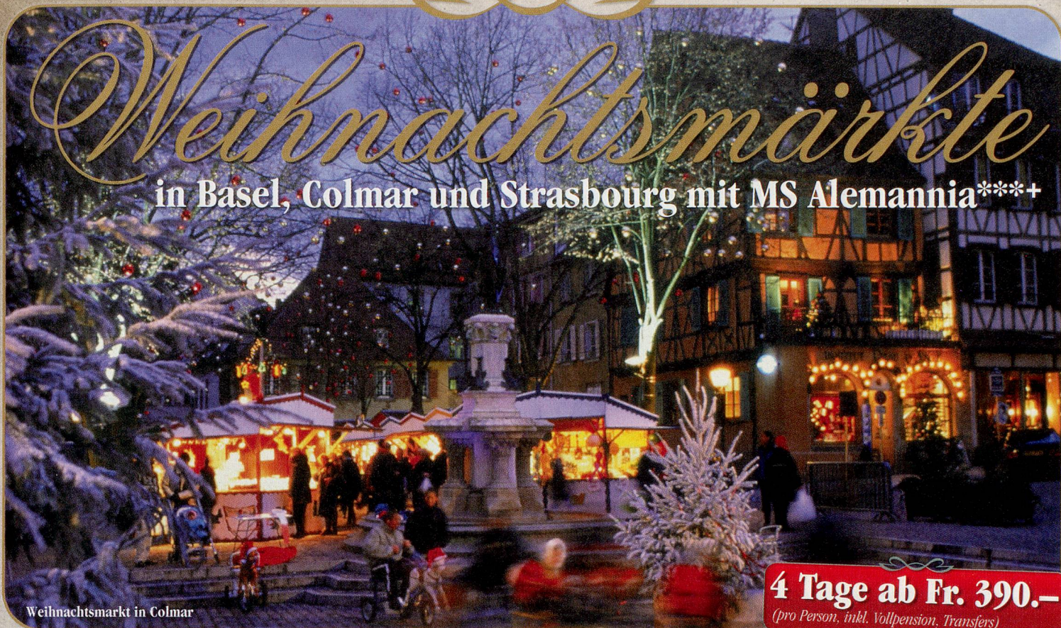
Weihnachtsmarkt in Colmar

4 Tage ab Fr. 390.- (pro Person, inkl. Vollpension, Transfers)