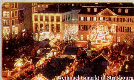
Weihnachtsmarkt in Strasbourg