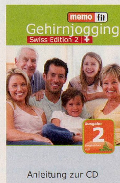
Anleitung zur CD

Memofit-Übungen können Sie aber auch online machen, indem Sie www.coop.ch/memofit zu Ihrer Trainingsplattform machen und ein Abo lösen (3 Monate CHF 20.–, 12 Monate CHF 49.–).