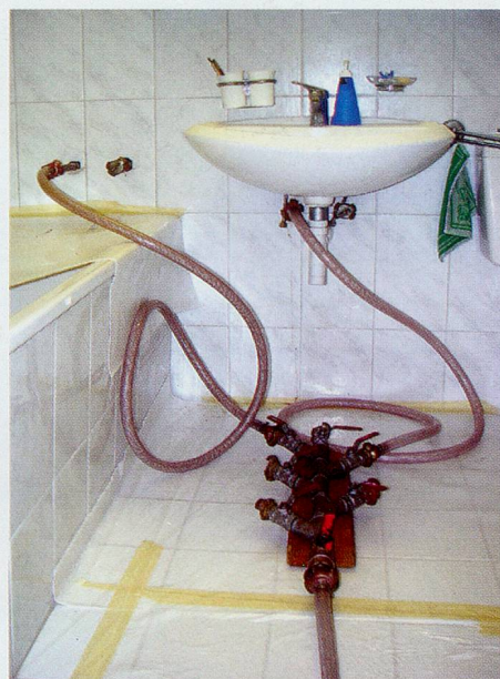
Nach der Rohr-Reinigung erfolgt die Innenbeschichtung der Wasserleitungen mit Epoxydharz.

Eine Innen-Sanierung der Leitungen durch Lining Tech AG ist 3x günstiger sowie 10x schneller als eine Neu-Installation. Ohne bauliche Umtriebe.