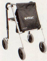
Avant LW – sehr gute Ergonomie und sehr leicht (5.8kg).

Verlangen Sie unsere Dokumentation und Händlerliste.