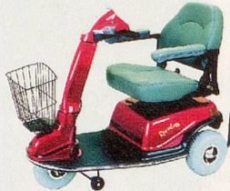
600T – komfortabel, wendig, kompakt.

Liteway 3 / 4 – wendig und stabil, mit 3 oder 4 Rädern, leicht faltbar und transportierbar.