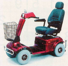
329LE – stark, komfortabel und grosse Reichweite.