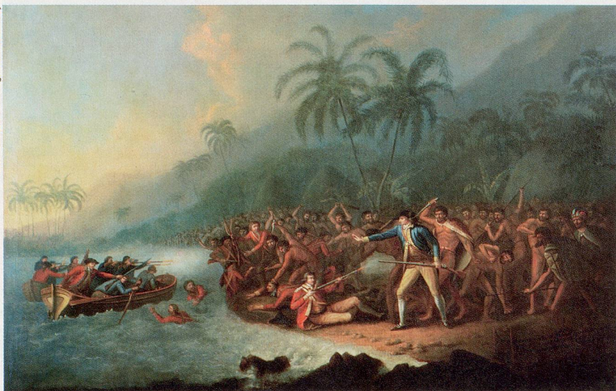
John Webbers – idealisierte – Darstellung des Todes von Captain James Cook auf Hawaii.