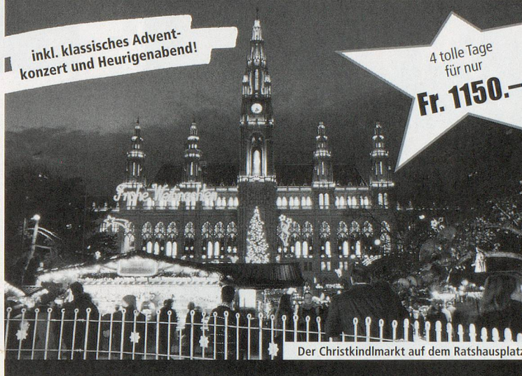
Der Christkindlmarkt auf dem Rathausplatz