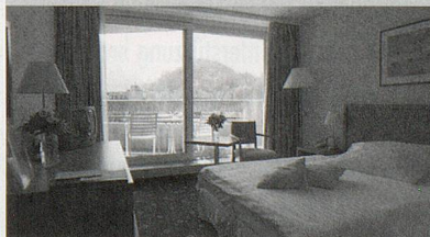
Ihr komfortables Zimmer im Hotel Metropol

Das beliebte 4-Sterne-Hotel Metropol liegt im Stadtzentrum von Interlaken und ist ideal für erstklassige und unvergessliche Tage inmitten der grandiosen Berg- und Seenlandschaft. Ihr komfortables Zimmer verfügt über TV, Radio, Telefon, Minibar, Bad/Dusche WC und Balkon. Nutzen Sie das vielseitige kulinarische Angebot von der asiatisch angehauchten Metrobar über das Spezialitätenrestaurant Bellini bis hinauf in die 18. Etage zum Restaurant Top o'Met mit Traumaussicht! Ein Poolbereich mit Sauna und Solarium sowie ein vielfältiges Fitnessprogramm rundet das Angebot ab und sorgt für aktive Erholung.