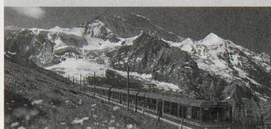
Die fantastische Fahrt zum Jungfrauojch ist ein einmaliges Erlebnis!