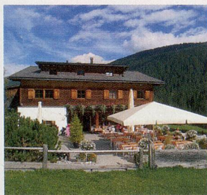
landgasthof LENGMATT lenger weilen

Gewinnen Sie zwei Nächte in der Herrschafts-Chammer des Land-gasthofs Lengmatta in Davos Frauenkirch für zwei Personen mit Halbpension und zwei Elektro-Flyer für einen Tag mit Picknick im Wert von CHF 666.-!