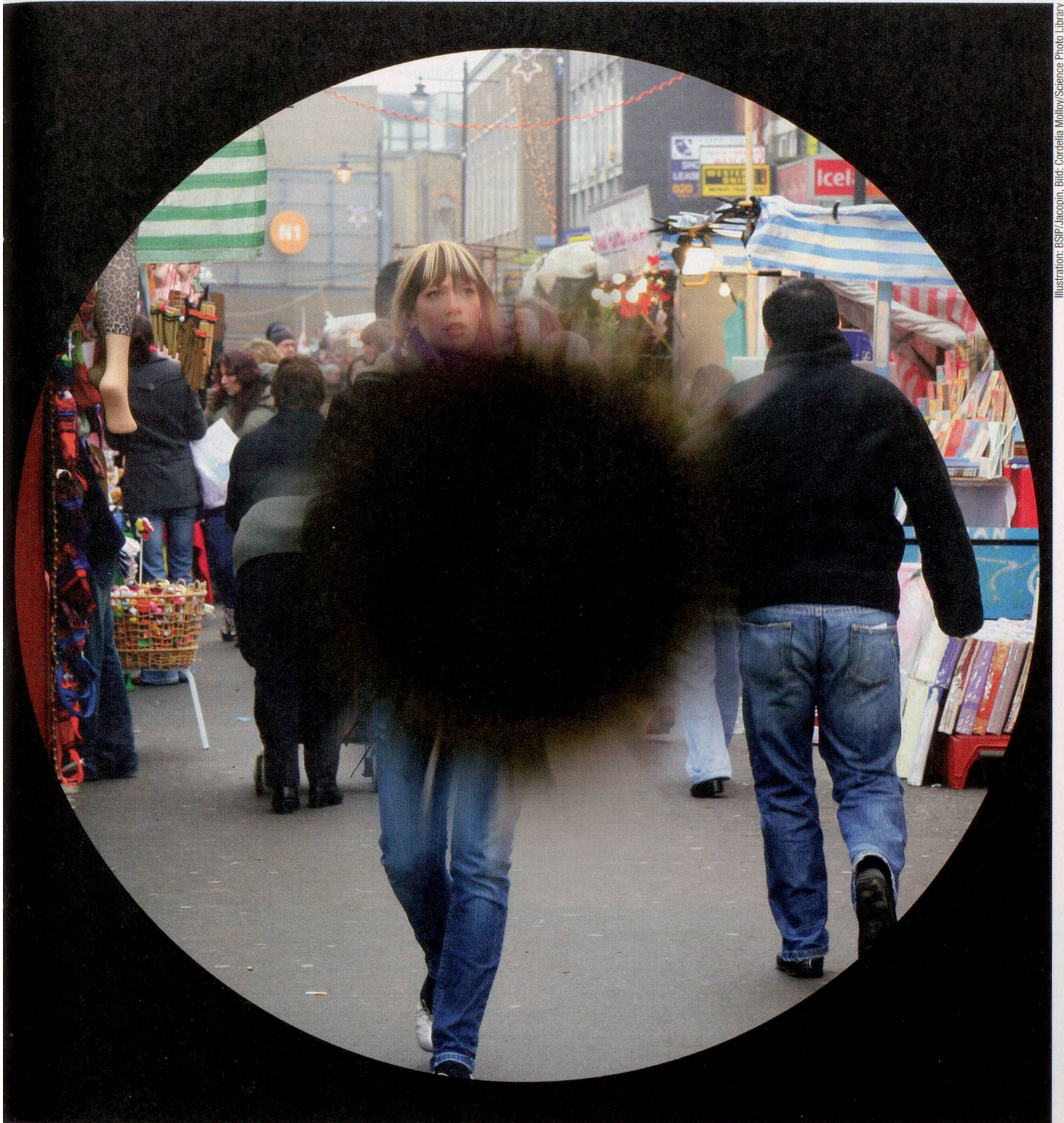
Illustration: BSP/Jacopin.

Antioxidantien kann die schädlichen freien Radikale neutralisieren und den Krankheitsprozess verlangsamen», so die Expertin.