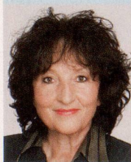
Bea Heim, Nationalrätin SP SO und Präsidentin der parlamentarischen Gruppe «Alter»

Krankheitsprävention und Gesundheitsförderung schaffen Lebensqualität und dämpfen Gesundheitskosten. Sie steigern die Arbeits- und Leistungsfähigkeit und damit die Wettbewerbsfähigkeit unserer Wirtschaft. Eine wirksame Präventionspolitik ist deshalb im Interesse aller, auch der Schweizer Wirtschaft.