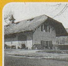
Brügglingen/ St. Jakob

Die grösste Musikinstrumenten-sammlung der Schweiz. Mi – Sa 14 – 18 h, So 11 – 17 h