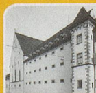
Im Lohnhof 9

Basler Wohnkultur 18. – 20. Jahrhun-dert, Keramische Sammlung, Uhren. Di – Fr, So 10 – 17 h, Sa 13 – 17 h