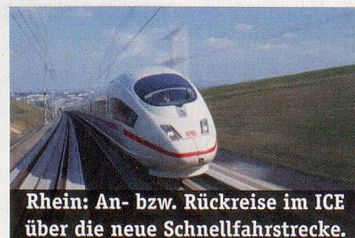
Rhein: An- bzw. Rückreise im ICE über die neue Schnellfahrstrecke.

Schiffe der guten Mittelklasse mit Auskabinen (Standard ca. 12 m²) für 184 bzw. 174 (MS My Story) Passagiere. Alle Kabinen mit Dusche/WC, Haartrockner, zentral gesteuerte Lüftung und SAT-TV. Die Fenster lassen sich nur auf dem Oberdeck öffnen. Gutbürgerliche Küche wird im Panorama-Restaurant «zur frohen Aussicht» zu einer Tischzeit serviert. Zur Bordausrüstung gehören Panoramasalon mit Bar, teilweise überdachtes Sonnendeck mit beheiztem Swimmingpool (MS Alemannia/Britannia), Saunabereich (MS My Story). Nichtraucherschiffe.