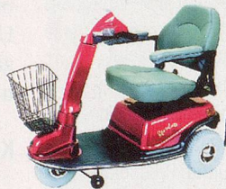
600T – komfortabel, wendig, kompakt.

Liteway 3 / 4 – wendig und stabil, mit 3 oder 4 Rädern, leicht faltbar und transportierbar.