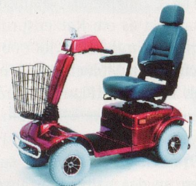
329LE – stark, komfortabel und grosse Reichweite.

Pflegeleistungen erwünscht: JA NEIN HOTEL JAKOBSBAD 9108 Gonten/Jakobsbad Telefon 071 794 12 33 Telefax 071 794 14 45 www.hotel-jakobsbad.ch