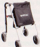
Avant LW – sehr gute Ergonomie und sehr leicht (5.8kg).

Bereitet Ihnen das Gehen, drinnen oder draussen, immer mehr Mühe? Bei uns finden Sie eine breite Palette von etac Rollatoren oder RASCAL Scootern. Verlangen Sie unsere Dokumentation und Händlerliste.