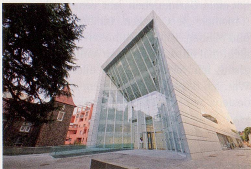
Bozens Museion, der neueste Tempel für moderne und zeitgenössische Kunst.

Man nehme die SBB bis Landquart, steige in die Rhätische Bahn um und fahre bis Zernez. Hier wechselt man ins Postauto. Dieses kurvt durch ein schönes Stück Nationalpark und hält nach einem Nickerchen – der Chauffeur bleibt natürlich hellwach – im Alpenstädtchen Mals. Schon Italien? Ma sì, auch wenn der mo-