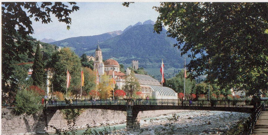
Meran, die Kurstadt an der Passeier: Hier flaniert man noch heute fast so edel wie einst die Kaiserin Sisi.