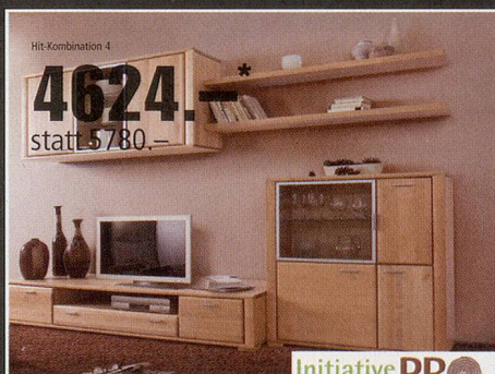
LANDO 115 643