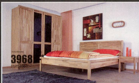
DANNY 115 782