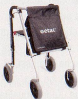
Avant LW – sehr gute Ergonomie und sehr leicht (5.8kg).

Verlangen Sie unsere Dokumentation und Händlerliste.