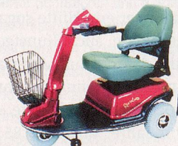
600T – komfortabel, wendig, kompakt.

Liteway 3 / 4 – wendig und stabil, mit 3 oder 4 Rädern, leicht faltbar und transportierbar.