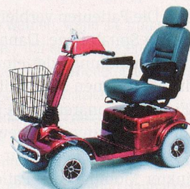
329LE – stark, komfortabel und grosse Reichweite.