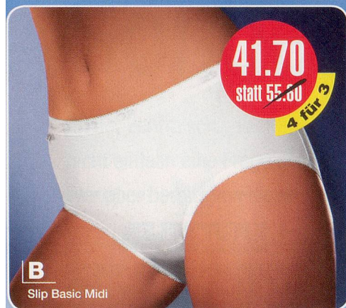
B Slip Basic Midi

D Sloggi Control Maxi 94% Baumwolle, 6% Lycra Maschinenwäsche 75-596.213 weiss 75-596.221 schwarz Grössen: 38-54 4 für 3 Fr. 59.70 statt 79.60