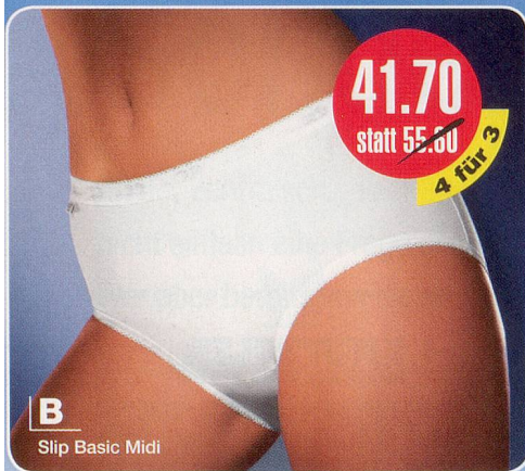
B Slip Basic Midi

D Sloggi Control Maxi 94% Baumwolle, 6% Lycra Maschinenwäsche 75-596.213 weiss 75-596.221 schwarz Grössen: 38-54 4 für 3 Fr. 59.70 statt 79.60