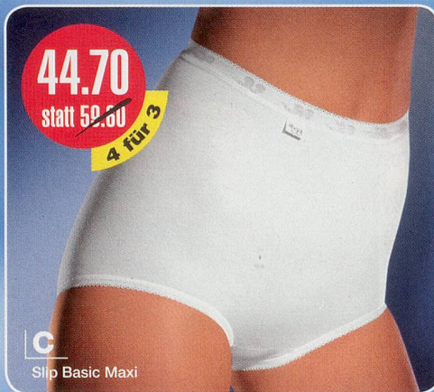
C Slip Basic Maxi