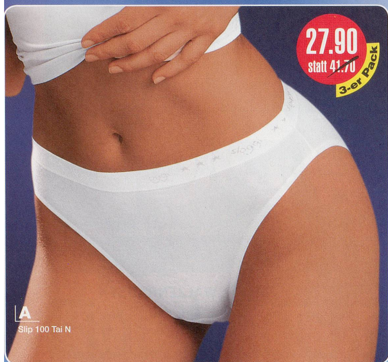
A Slip 100 Tai N

A Sloggi 100 Tai N 95% Baumwolle, 5% Lycra Maschinenwäsche 75-596.171 weiss Grössen: 36-46 3-er Pack Fr. 27.90 statt 41.70