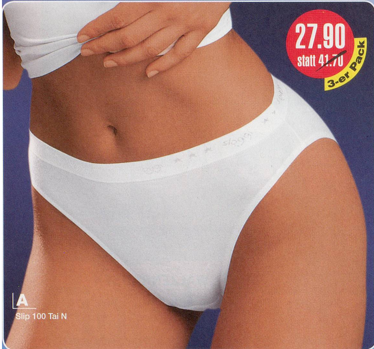
A Slip 100 Tai N

A Sloggi 100 Tai N 95% Baumwolle, 5% Lycra Maschinenwäsche 75-596.171 weiss Grössen: 36-46 3-er Pack Fr. 27.90 statt 41.70