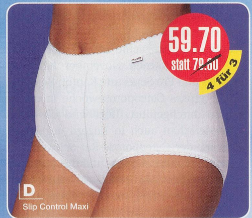
D Slip Control Maxi