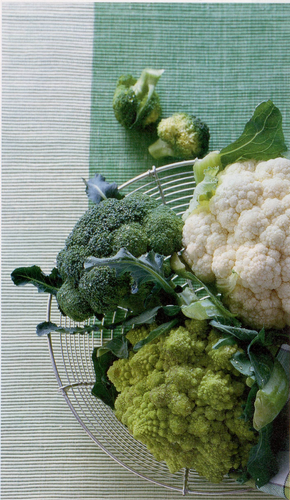
REZEPT: SAISONKÜCHE

Übrigens gehört Indien zu den Hauptproduzenten des weissen Traubenkohls, von dem es auch rote und grüne und violette Sorten gibt. Am elegantesten aber ist er natürlich in Blütenweiss. ■