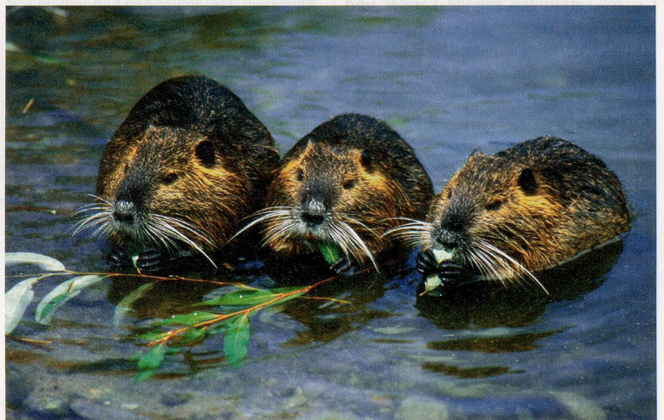
Wir sind wieder da: Die Biber sind daran, ihren Platz in Europa zurückzuerobern.

Mit ihrer Wasserbautätigkeit prägen Biber in natürlichen Lebensräumen seit Jahrtausenden die Landschaft und fördern die Artenvielfalt. Verlassene Bibersteiche verlanden mit der Zeit zu Mooren und Wiesen und werden erst spät durch den umliegenden Wald zurückerobert. Biber sind anpassungsfähige Kulturfolger und können auch in der dicht besiedelten Schweiz leben, sofern sie toleriert werden. In intensiv genutzten Landschaften muss mit einem Bibermanagement aufgeklärt werden, wie das Zusammenleben von Mensch und Tier möglich ist und wie man Biberschäden vorbeugen kann. ■