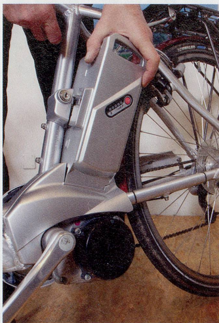
Klein und leicht: Die moderne Batterie lässt sich zum Laden locker entfernen.

Ihre Lebensdauer liegt bei etwa 10 000 Velokilometern. Bei einigen E-Bikes wird die Batterie mit einem einfachen Handgriff abmontiert und im externen Lade-