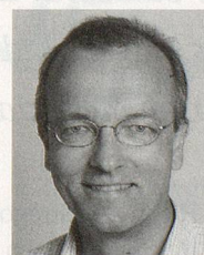
DAGEGEN: Hans-Jürg Fehr, Präsident der SP Schweiz, Nationalrat SH

Vergleich gute Position zu verlieren. Der Steuerwettbewerb unter den Kantonen wirkt dem entgegen. Im Idealfall führt er zum Zuzug von guten Steuerzahlern, und er eröffnet «steuersensitiven» Topverdienern Lösungsalternativen, ohne dass sie ins Ausland ausweichen müssen. Das jüngste Beispiel des Kantons Obwalden zeigt auch, dass der grosse Wirbel um die steuerliche Entlastung und degressive Besteuerung der Topverdiener die beste Werbung ist, um mit tatkräftiger Unterstützung der Medien und Politiker auf die steuerliche Attraktivität eines Kantons hinzuweisen. Vielleicht geht dann die Rechnung eben gerade deswegen für alle Steuerzahler auf.