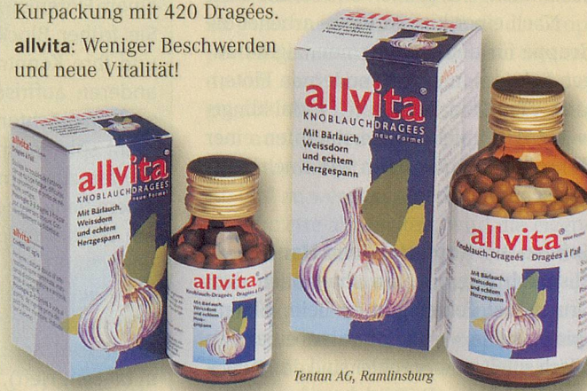
Tentan AG, Ramllinsburg

allvita: Weniger Beschwerden und neue Vitalität!