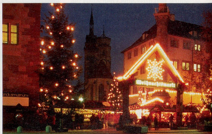
Hell erleuchtete Festfreude: Stuttgarts Weihnachtsmarkt gehört zu den grössten und schönsten in Europa.