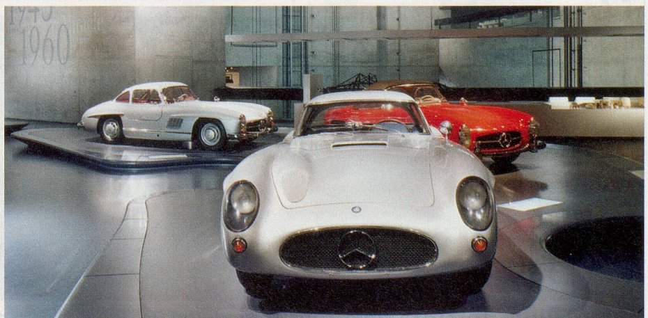
Viel Pferdestärken in edler Verkleidung: Das neue Mercedes-Benz-Museum zeigt elegantes Design in moderner Architektur.

► Weitere Informationen: www.stuttgart.de www.deutschland-tourismus.de