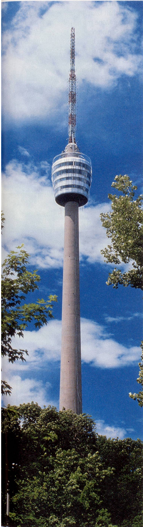
Schöne Aussichten: Der Fernsehturm, ein weiteres Stuttgarter Wahrzeichen.

seum wurde dieses Jahr neu eröffnet und besticht durch seine moderne Architektur. Das neue Porsche-Museum wird im Jahre 2008 eröffnet, bis dahin steht Interessierten das alte offen.