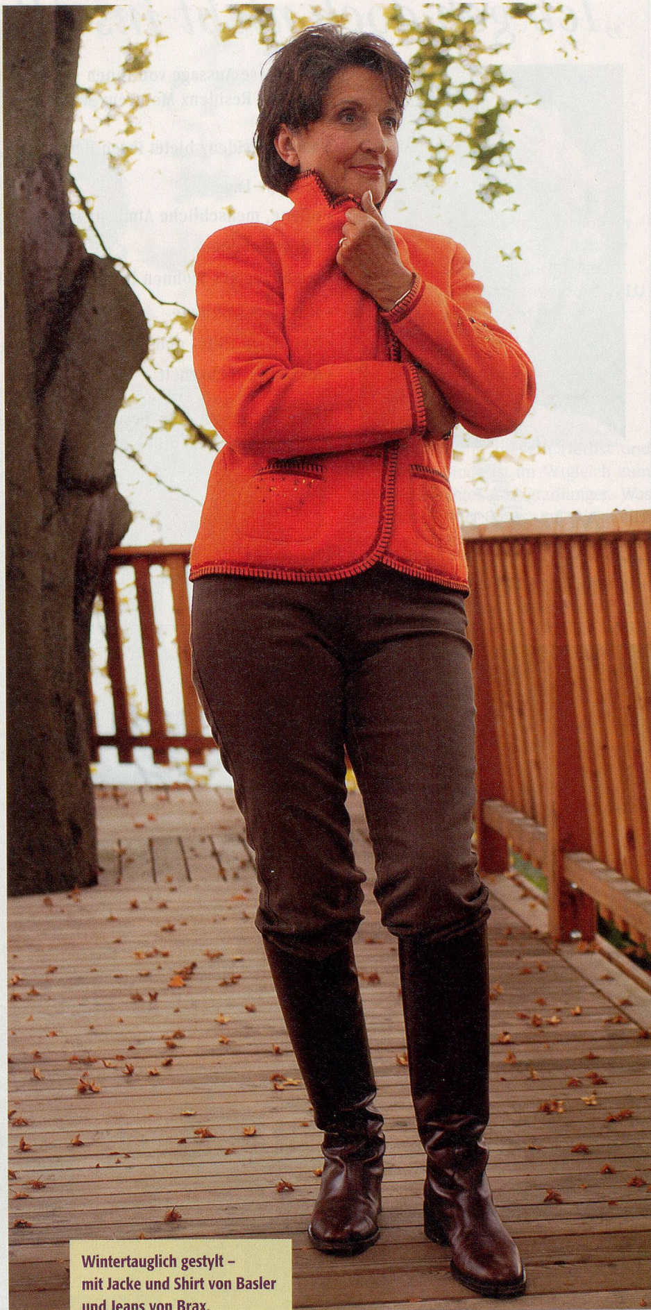
Wintertauglich gestylt – mit Jacke und Shirt von Basler und Jeans von Brax.