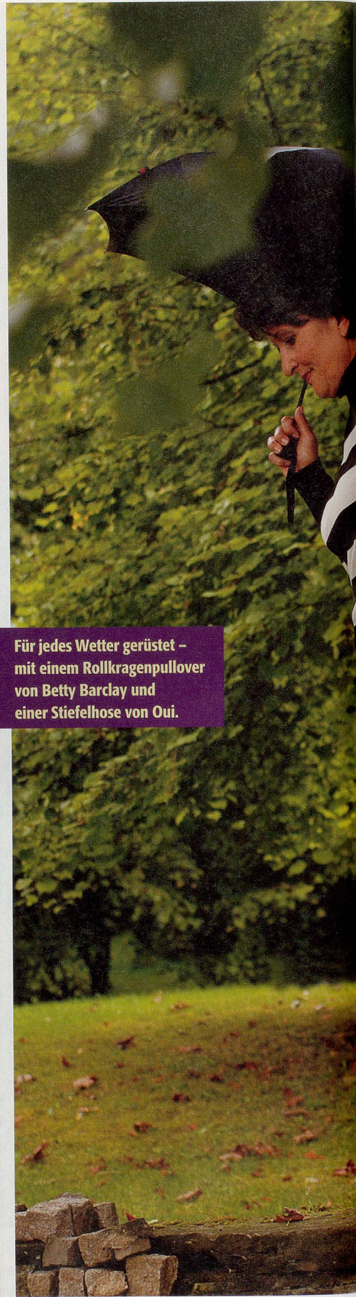
Für jedes Wetter gerüstet – mit einem Rollkragenpullover von Betty Barclay und einer Stiefelhose von Oui.