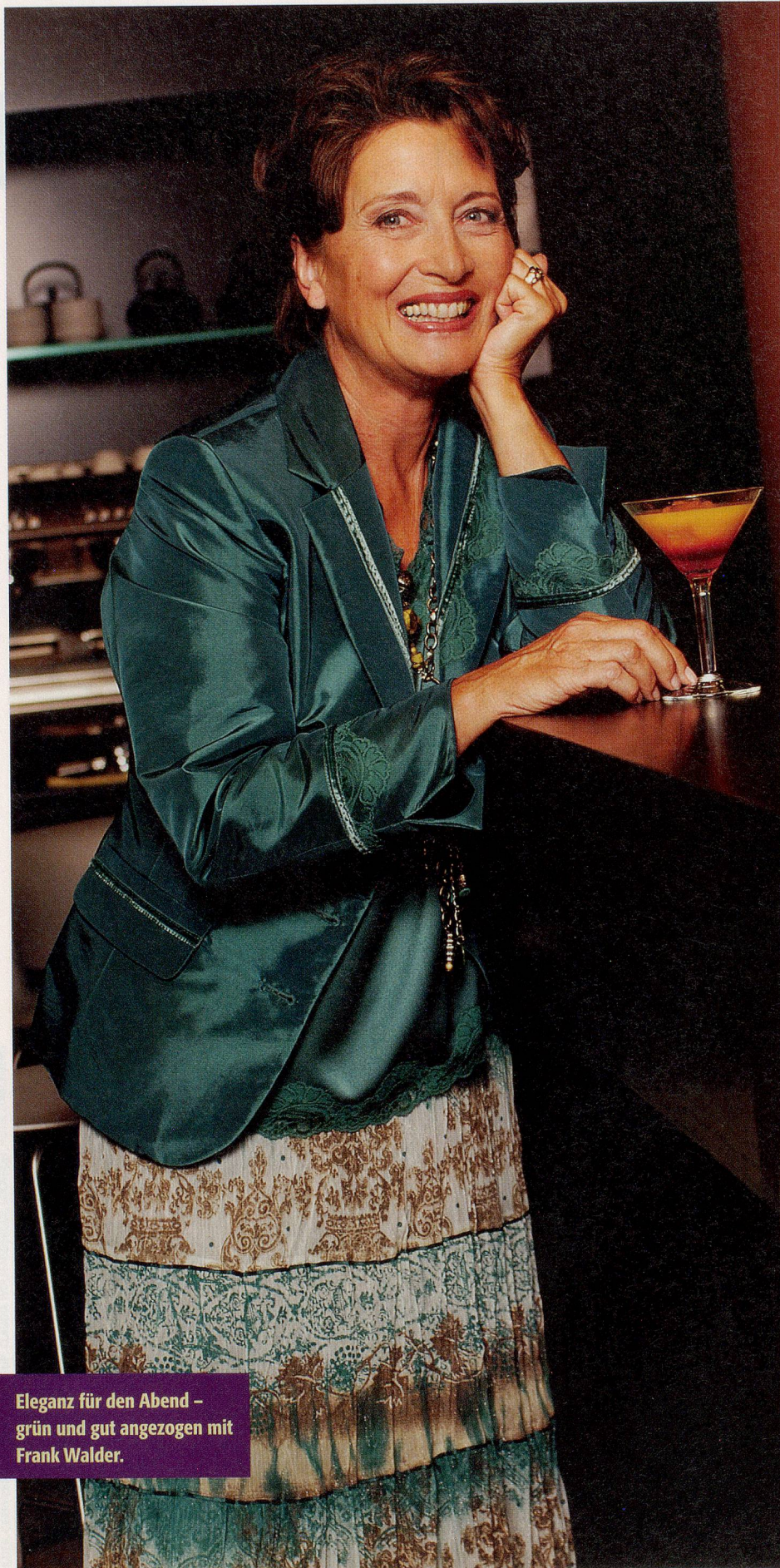
Eleganz für den Abend – grün und gut angezogen mit Frank Walder.