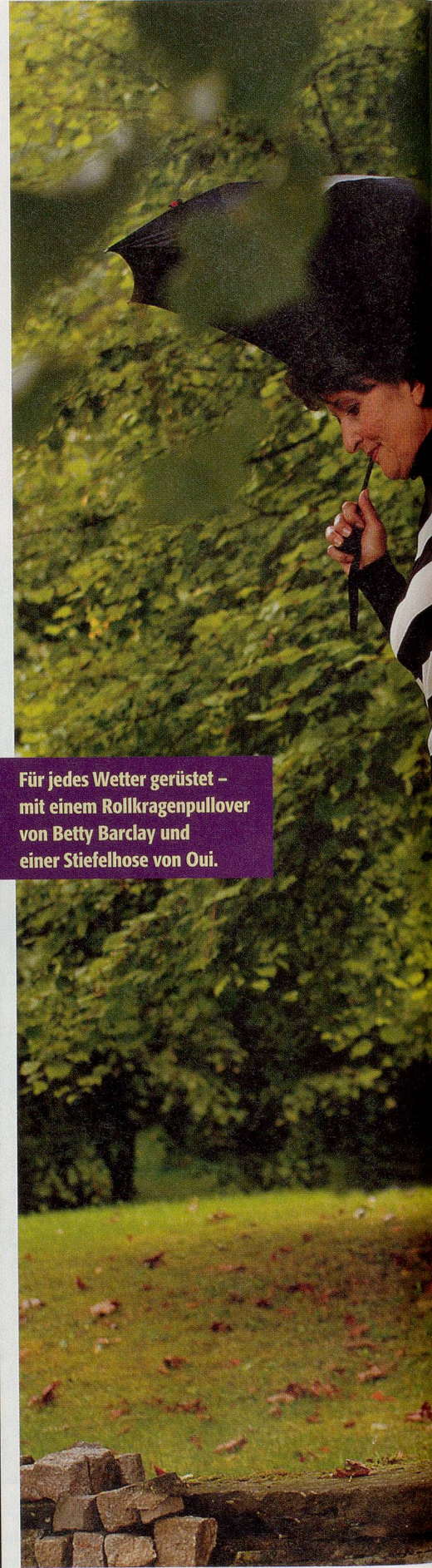
Für jedes Wetter gerüstet – mit einem Rollkragenpullover von Betty Barclay und einer Stiefelhose von Oui.