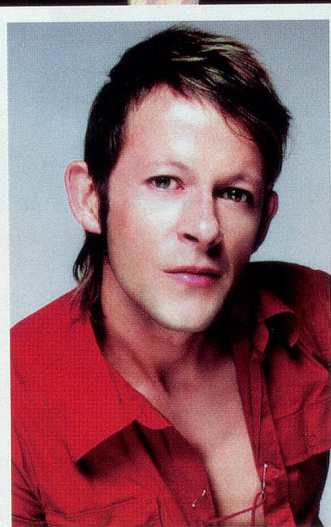
Michael von der Heide