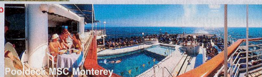
Pooldeck MSC Monterey

Lissabon (23.9.) Ein Höhepunkt - die portugiesische Hauptstadt Lissabon!