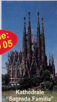
Kathedrale "Sagrada Familia"