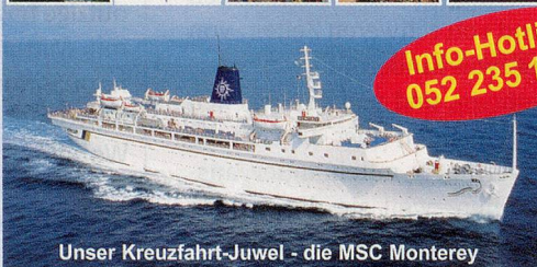
Unser Kreuzfahrt-Juwel - die MSC Monterey