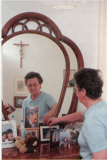
Liebe Erinnerungen: Auch Souvenirs an früher gehören zur Oasi-Stimmung.

Zwar hatten einige der Frauen und Männer, die inzwischen in der Oasi leben, in der Schweiz auch Deutsch gelernt. Doch Erfahrungen und Erkenntnisse aus der Altersarbeit zeigen, dass mit zunehmendem Alter die Muttersprache in den Vordergrund tritt. Einige der heutigen Oasi-Bewohnerinnen sind von tra-