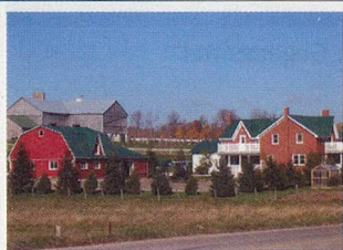
Typische Mennoniten-Farm in Süd-Ontario.