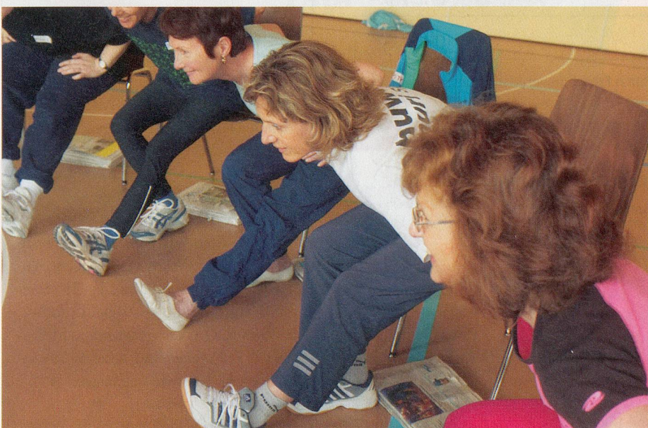
Anleitung für Leiterinnen: Den eigenen Körper und den der Senioren besser verstehen.