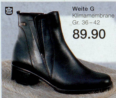
Weite G Klimamembrane Gr. 36–42 89.90