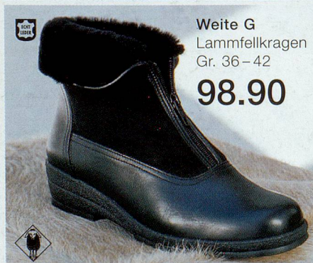
Weite G Lammfellkragen Gr. 36–42 98.90