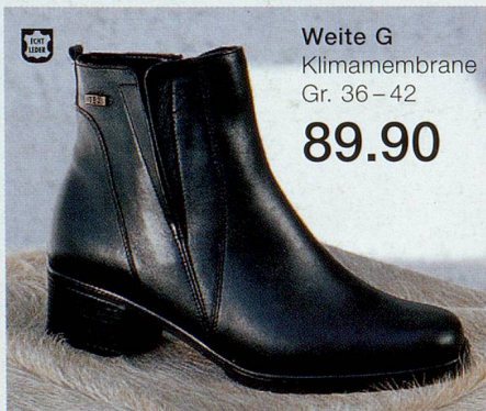
Weite G Klimamembrane Gr. 36-42 89.90