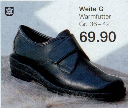
Weite G Warmfutter Gr. 36–42 69.90

Diese Schuhe bieten Ihnen den besten Tragkomfort. Sie sind sorgfältig verarbeitet und dank Mehrweiten werden sie jedem Fusstyp gerecht. Neben der Exklusivmarke «Conforsana» umfasst die Comfort-Abteilung viele Modelle aus der Jenny-Kollektion.