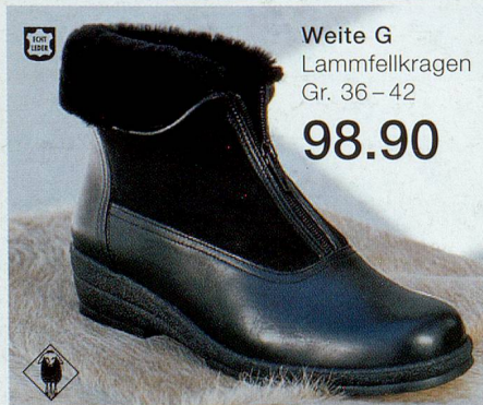
Weite G Lammfellkragen Gr. 36-42 98.90