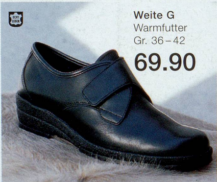
Weite G Warmfutter Gr. 36-42 69.90

Diese Schuhe bieten Ihnen den besten Tragkomfort. Sie sind sorgfältig verarbeitet und dank Mehrweiten werden sie jedem Fusstyp gerecht. Neben der Exklusivmarke «Conforsana» umfasst die Comfort-Abteilung viele Modelle aus der Jenny-Kollektion.