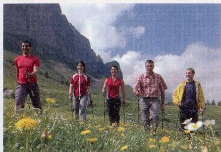
Gesundheit und Spass mit Nordic Walking

Die hügelige, prachtvolle Ferienregion über dem Bodensee lädt zum Verweilen ein. Hier verbirgt sich eine der schönsten und noch unberührtesten Regionen zum Ausspannen. Sie ist einzigartig für Wanderfreunde, Sonnengeniesser und Gesundheitsbewusste. Zudem versetzt das unverfälschte, vielfältige und einzigartige Brauchtum Gross und Klein in Staunen. Ein Ja zu Wohlbefinden und Genuss – ein Ja zum Appenzellerland.