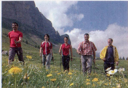
Gesundheit und Spass mit Nordic Walking

Die hügelige, prachtvolle Ferienregion über dem Bodensee lädt zum Verweilen ein. Hier verbirgt sich eine der schönsten und noch unberührtesten Regionen zum Ausspannen. Sie ist einzigartig für Wanderfreunde, Sonnengeniesser und Gesundheitsbewusste. Zudem versetzt das unverfälschte, vielfältige und einzigartige Brauchtum Gross und Klein in Staunen. Ein Ja zu Wohlbefinden und Genuss – ein Ja zum Appenzellerland.