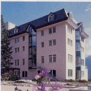
REHA-Klinik Hasliberg Kurhaus Haslibergerhof 6083 Hasliberg Tel. 033 972 55 55 info@haslibergerhof.ch www.haslibergerhof.ch

Ist die Stärkung der Muskulatur schon fortgeschritten, kann gezielt mit der medizinischen Trainingstherapie die Muskelkraft gesteigert werden. Das Gehtraining und Training der Alltagsaktivitäten erleichtert den Wiedereinstieg ins Alltagsleben zu Hause. Abgerundet wird das Angebot für die orthopädischen Patienten durch Gruppenaktivitäten und geführte Spaziergänge.