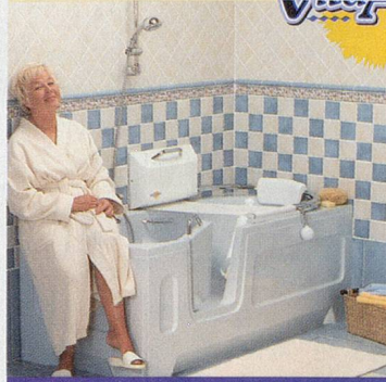
Lift paßt auch auf Ihre vorhandene Badewanne

VitaActiva, der Spezialist für sicheres, unbeschwertes Badevergnügen