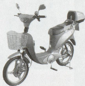
Diverse Modelle ab Fr. 690.--