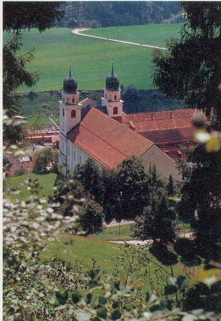
Juwel in den Bergen: Das Kloster Disentis bietet aussen wie innen prächtige Anblicke.

17.06 Uhr: Abfahrt in Richtung Arth-Goldau. Ankunft: 18.05 Uhr. Umsteigen.