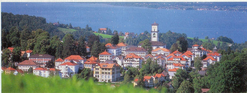
Biedermeier-Dorf Heiden hoch über dem Bodensee