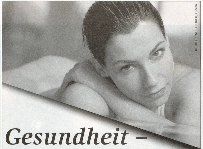
HILKER UND HILKER, Luzern

IncoSan GmbH, Postfach 57, CH-9053 Teufen, Fax 071 333 50 13