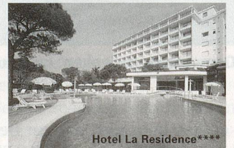
Hotel La Residence****

Carreise ab der ganzen Deutschschweiz vom 19.02. bis 29.10. jeden Samstag und zusätzlich jeden Montag in der Hochsaison. Sie haben die Wahl aus 17 Hotels der *** und **** Kategorie.