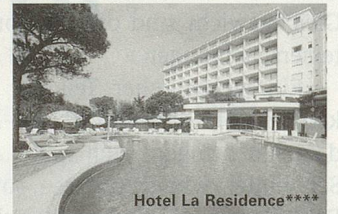
Hotel La Residence****

Carreise ab der ganzen Deutschschweiz vom 19.02. bis 29.10. jeden Samstag und zusätzlich jeden Montag in der Hochsaison. Sie haben die Wahl aus 17 Hotels der *** und **** Kategorie.