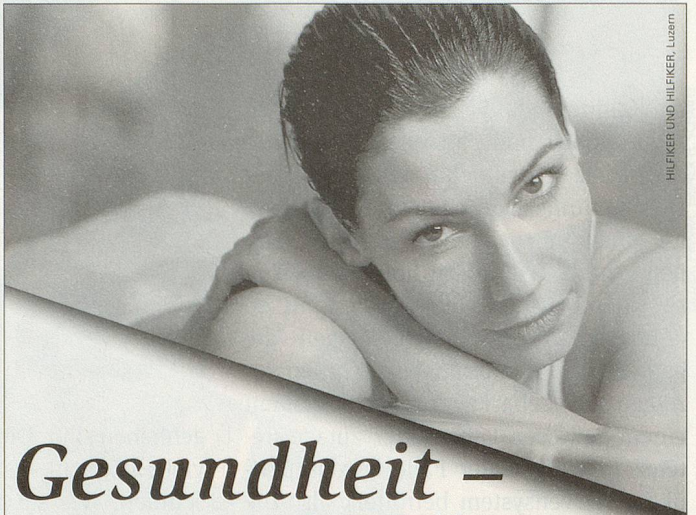
HILFRIKER UND HILFER, Luzern