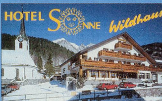
HOTEL SONNE Wildhaus

Hallenbad, Sonnenterrasse, heimelige Komfortzimmer