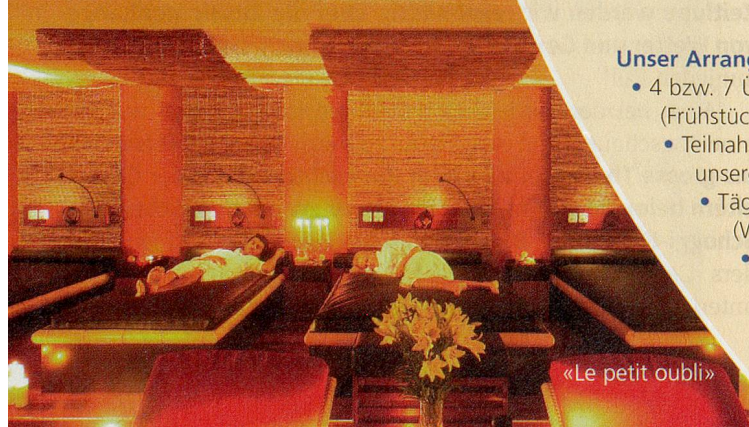
«Le petit oubli»