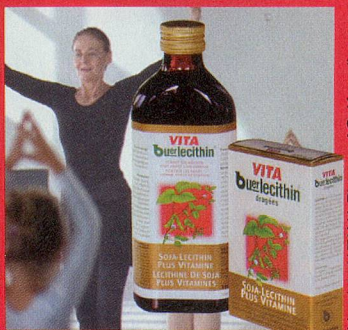
Vertrieb: ALTANA Pharma AG, Kreuzlingen

In Apotheken und Drogerien. Lesen Sie die Packungsbeilage.