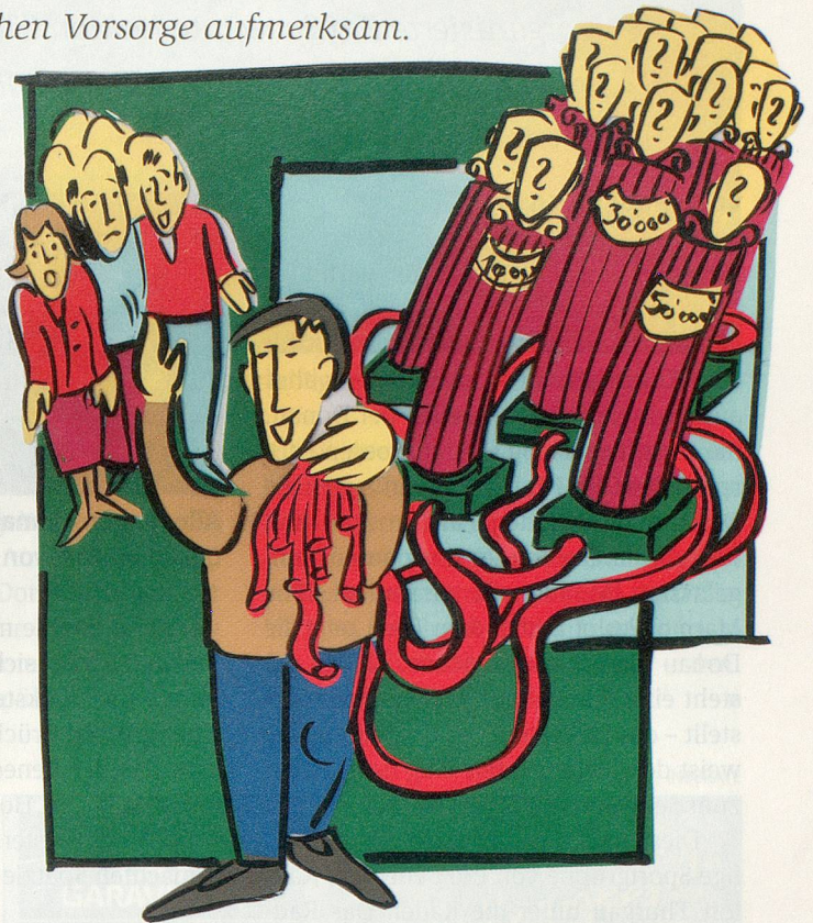
ILLUSTRATION: BARBARA BIETENHOLZ

zwanzig Fällen hat er vergessene Guthaben von über einer Million Franken entdeckt. Das beglückt nicht nur die betroffenen Pensionäre. Auch der Staat, und damit die Steuerzahler, stehen in Kaltenrieders Schuld, wenn Zusatzleistungen der AHV oder Fürsorgегelder zurückerstattet oder nicht beansprucht werden.