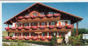
Nesselwang *** im Allgäu Gästehaus Stimpfle mit Restaurant Schwyzerstüble

Fam. P. Schmid, 7504 Pontresina Tel. 081 838 82 00, Fax 081 838 82 30 www.chesa-mulin.ch , info@chesa-mulin.ch