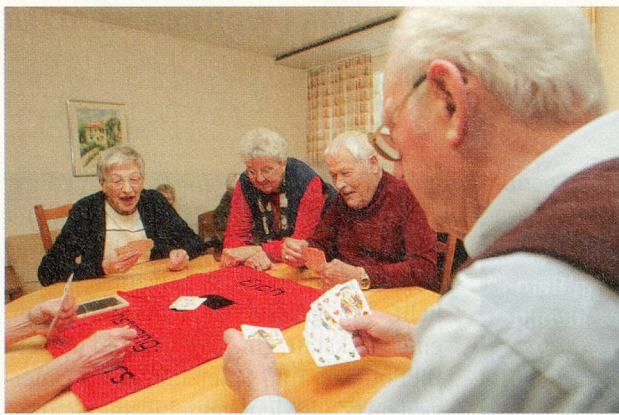
Das Wohnen ein Spiel: Auch beim Jass wird an der Pestalozzistrasse die Gemeinschaft gepflegt.

Wieder andere konnten sich mit der Idee der Gemeinschaft nicht anfreunden.