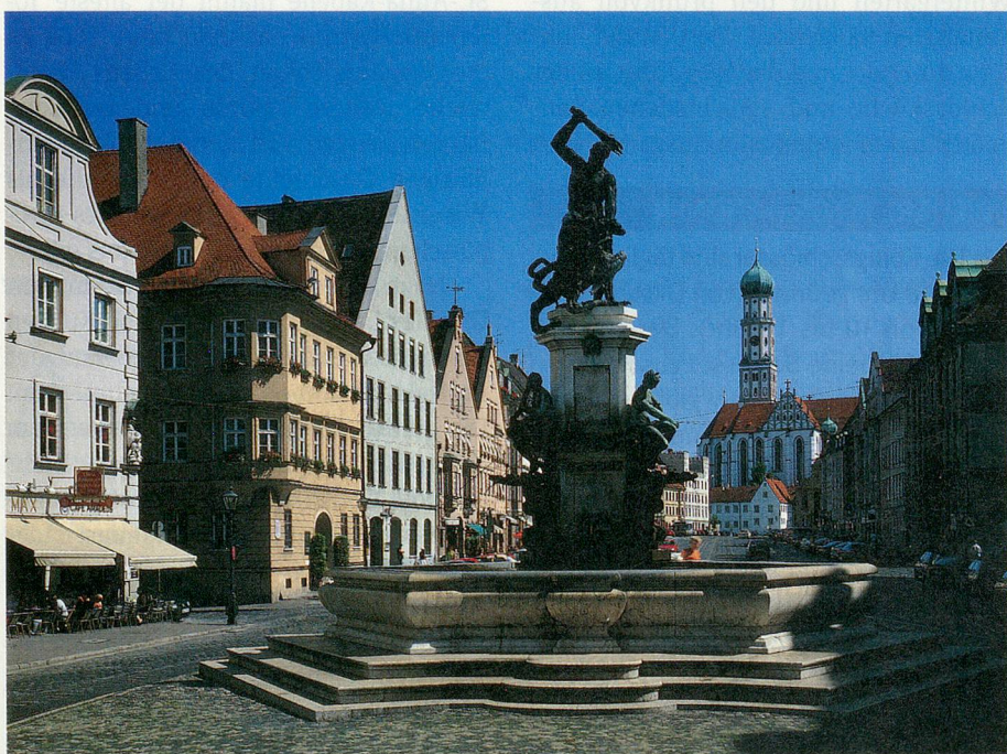
In der Stadt der schwerreichen Fugger: Die Maximilianstrasse in Augsburg.

➤ Inbegriffene Leistungen: Fahrt im Komfortcar, fünf Übernachtungen im Doppelzimmer resp. Einzelzimmer (3-Sterne-Hotels) mit Frühstück; Bustransfers gemäss Programm; fünf Mittagessen unterwegs (Basis 3-Gang-Menü) ohne Getränke; Stadtrundgänge durch Regensburg, Augsburg und München; Eintritte