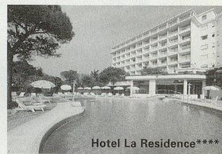
Hotel La Residence****

Carreise im luxuriösen 5-Stern-Bus ab der ganzen Deutschschweiz vom 14.02. bis 13.11. jeden Samstag und zusätzlich jeden Montag in der Hoch- saison. Sie haben die Wahl aus 17 Hotels der *** und **** Kategorie.