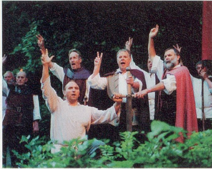
Geloben unter freiem Himmel: Gegen 200 Laiendarsteller machen mit!

Bis zur Premiere steht jedes Mal eine harte Probenarbeit an: Von März bis Juni wird geübt – oft bei Wind und Wetter, Nässe und Kälte. Der Applaus des Publikums entschädigt dann aber alle Mitwirkenden voll für die strenge, anforde-