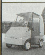
Kabine mit Heizung

Wenn gehen schwerfällt Allwetter-Elektro-Mobile führerscheinfrei