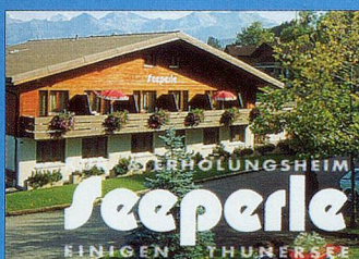
Seeperle ERHOLUNGSHEIM EINIGEN THUNERSEE

ist ein kleiner Familienbetrieb mit 24 Betten. Abseits der Hauptstrasse mit mildem Seeklima und ländlicher Umgebung auf 580 m ü. M.