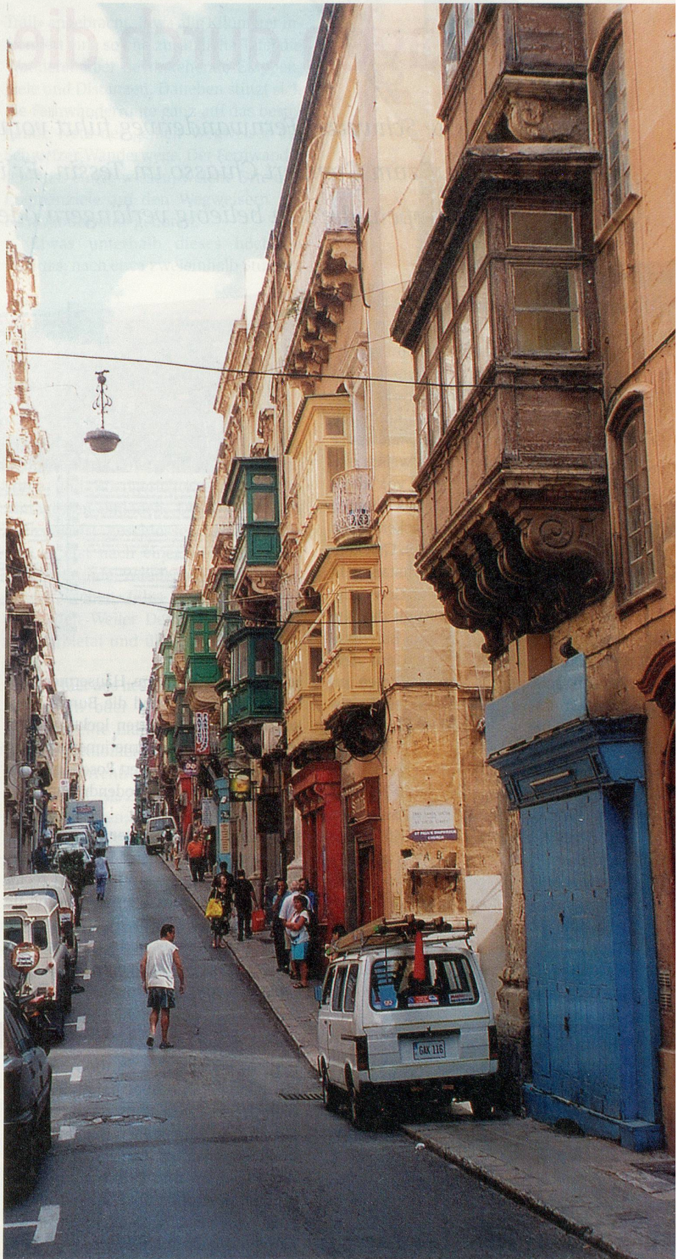
Bummeln in den Gassen Vallettas – bunte Holzbalkone prägen das Stadtbild.

Die beste Zeit für Ferien auf Gozo oder Malta ist für Hitzeempfindliche im Frühjahr oder Herbst. Und warum nicht einmal dem Winter entfliehen, es sich im milden Klima Gozos gut gehen lassen und dies vielleicht mit einem Sprachaufenthalt verbinden, um Englisch zu lernen? Ferien auf Malta oder Gozo können, müssen aber nicht teuer sein. Besonders in der Nebensaison gibt es attraktive günstige Pauschalarrangements. ■