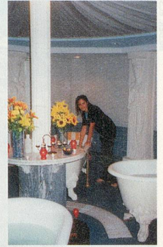
Sich wohl fühlen im Pool oder Naturbad im Ta'Cenc auf Gozo oder im Kleopatrabad im Corinthia Palace auf Malta (rechts).

die Italiener, sprechen wie die Araber, woher die bloss kommen mögen?»