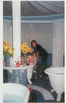
Sich wohl fühlen im Pool oder Naturbad im Ta'Cenc auf Gozo oder im Kleopatrabad im Corinthia Palace auf Malta (rechts).

die Italiener, sprechen wie die Araber, woher die bloss kommen mögen?»