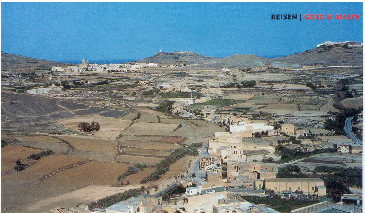
Die Zitadelle des Inselhauptstädtchens Victoria (Rabat) bietet eine wunderschöne Rundschau über Gozo.