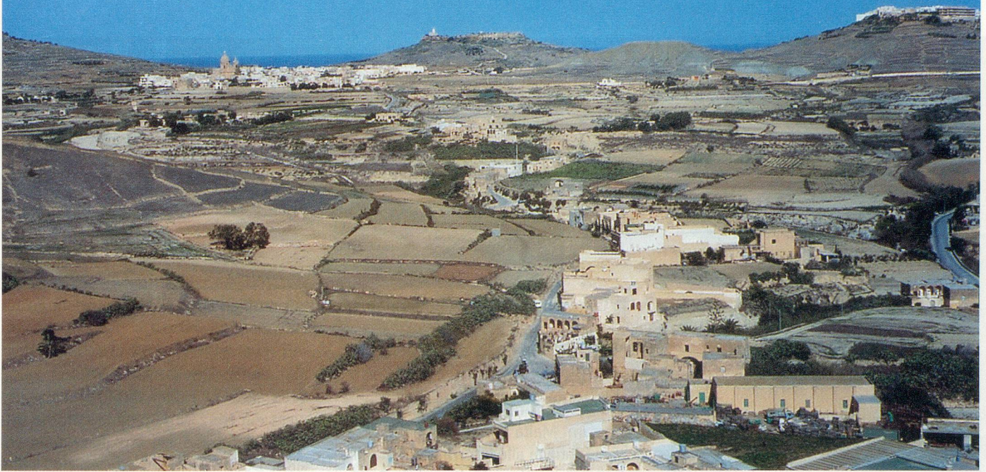
Die Zitadelle des Inselhauptstädtchens Victoria (Rabat) bietet eine wunderschöne Rundschau über Gozo.