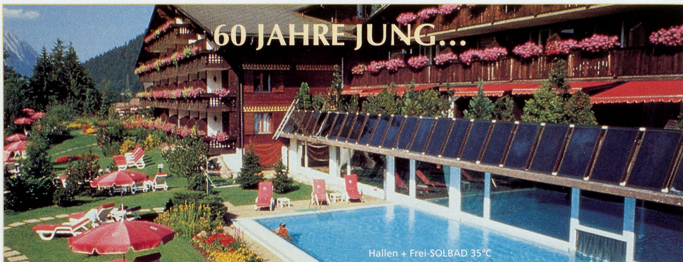
Hallen + Frei-SOLBAD 35°C

...und kein bisschen weiser! Oder doch... denn jetzt beginnt im Wellness Hotel Ermitage-Golf die «Weisheit» Früchte zu tragen.